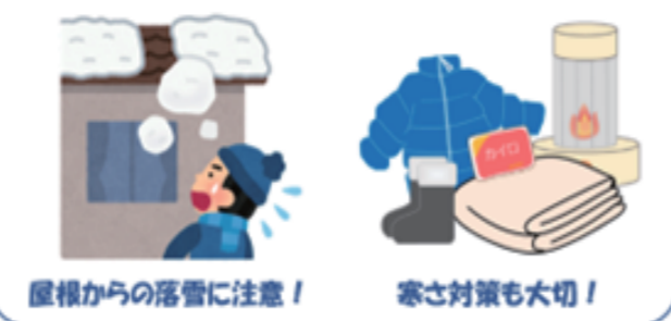
屋根からの落雪に注意!